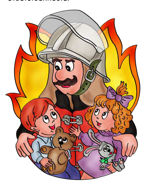
Меры по предупреждению пожаров по причине детской шалости:

проводят на улице. Родители находятся на работе и постоянно контролировать игры своих детей, могут. Родители должны понимать, что «игры» с огнем их детей в безлюдных местах, таких как заброшенные стройки, расселенные жилые дома, заброшенные гаражи и стайки, могут привести к плачевным последствиям, так в пожарное подразделение сообщение о пожаре поступит поздно, помощи попросить будет не у кого. Так же забывать, стоит причинение ущерба чужому имуществу предусмотрены не только меры административного воздействия, HΩ и уголовная ответственность.